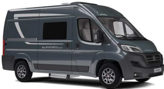
Abbildung ist ein Fiat Modell!

Irrtum, Preisänderung und Änderungen der technischen Angaben vorbehalten – Alle Preise inkl. MWST