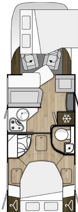
Tessoro 495 UP